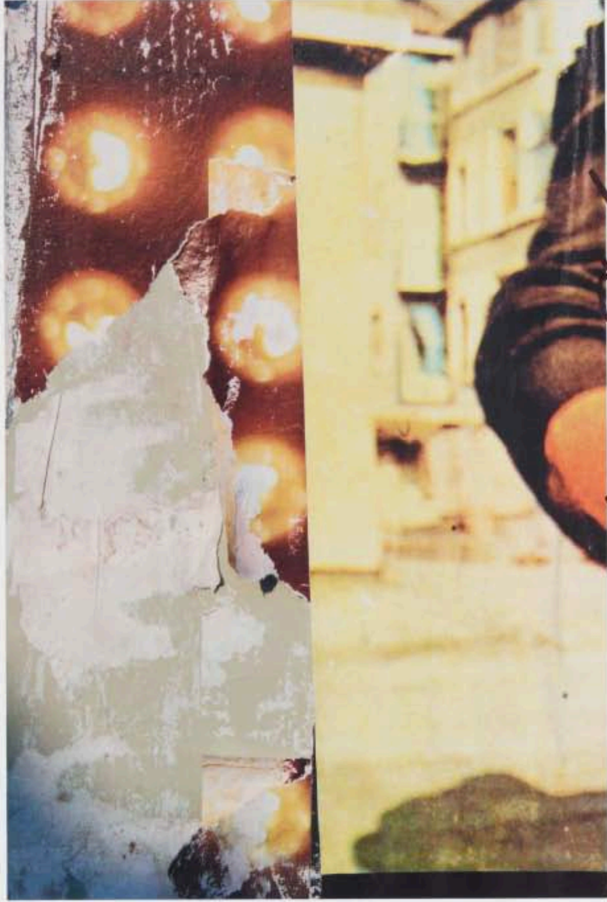
Alle Schönhanseer Straße